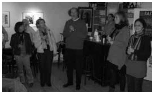
Ausstellungseröffnung im Kulturladen St. Georg

Und schließlich greift die Verbetriebswirtschaftlichung im „Konzern Hamburg“ auch immer mehr in den Bereich der Stadtteilkultur durch. Erfolg wird an inhaltsleeren, aber mit bürokratischem Aufwand zu ermittelnden so genannten