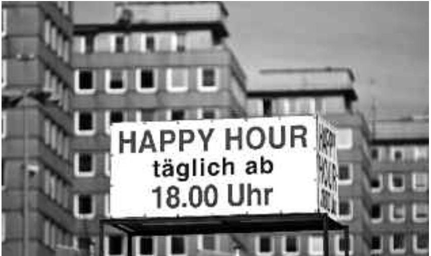
Das Bezirksamt Mitte

Tja, so ändern sich die Zeiten: Jetzt nach der Wahl wird die demokratische Be-